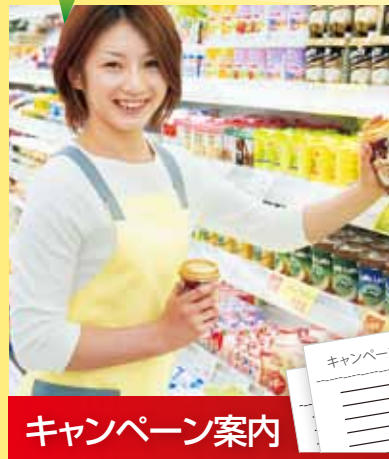
キャンペーン案内